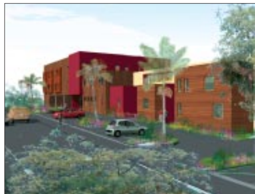
Parc d'activités des Plaines - Perspective du «pôle bois».

On n'oubliera pas l'important programme de renouvellement