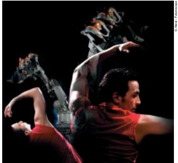
« Danse avec les robots ».