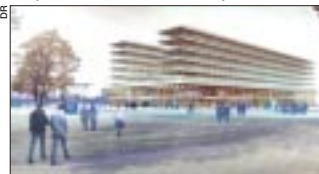
Maquette de l'Hôtel Rennes Métropole.

Sur Chantepie située en périphérie de Rennes, Territoires intervient sur deux opérations : la restructuration du centre-bourg et la Zac des Rives-du-Blosne (2 600 logements dont 1 800 collectifs) qui accueille, dans une logique de mixité sociale, une opération originale