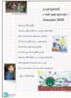
L'affiche du concours.

La propreté apparaît comme un problème récurrent, comme en témoigne la récente enquête de satisfaction menée par la Semise sur les ascenseurs. En juin, démarrera une campagne d'affichage qui jouera sur l'humour plutôt que sur l'interdiction pure. Plus visuelle, elle se substituera aux traditionnelles affiches que les gens ne lisent plus et permettra d'atteindre les locataires qui ne com-