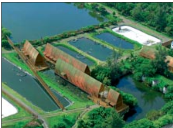
Etang Salé - Centre des Eaux Douces.

Historiquement, la Semac est marquée par une mission d'intérêt général dans un département d'outre-mer (Dom) où prévaut un taux élevé de logement social. «La sem s'est structurée autour de cette activité. Elle a acquis un savoir-faire et des compétences qui lui