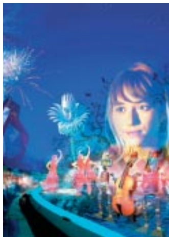
Spectacle au Kinemax.