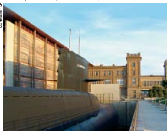
L'ancienne gare transatlantique réhabilitée en complexe ludo-scientifique.

de style art déco abrite, depuis 2002, un vaste complexe ludoscientifique qui a redonné du souffle à tout un bassin de vie. Pavillon d'expositions permanentes de 1 300 m 2 liées à l'aventure de l'exploration sous-marine, gigantesque aquarium cylindrique