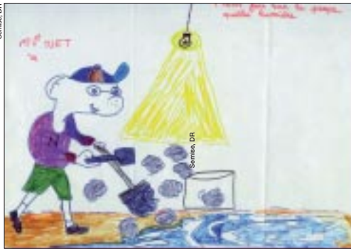
Le premier prix!

Courant mai, la Semise va lancer l'édition 2006 de « La propreté c'est pas sorcier ! » destinée aux 6-16 ans. Après le dessin et la poésie, les arts plastiques seront à l'honneur cette année : « A partir de la bouteille en plastique de ton choix, laisse libre cours à ton imagination et réalise une œuvre d'art ». Un jury, composé de représentants de la Sem, de locataires et d'amicales, devra désigner le plus bel objet réalisé, lequel aura peut-être le privilège d'être exposé au musée d'art contemporain du Val-de-Marne, situé à Vitry. Quant à la remise des prix, elle se déroulera le 21 juin, « un mercredi en fin d'après-midi afin d'associer les parents », précise Véronique Simonnet, responsable de la communication. « Un concours où tous les participants gagnent. Certes les premiers prix sont plus importants : vélo, console jeux ; ensuite