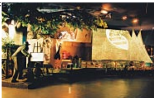
Ambiance pêche sur le parcours des impressionnistes.