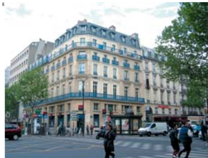
Immeuble à l'angle du boulevard de Strasbourg et du boulevard Saint-Martin.

Au titre de la maîtrise d'ouvrage déléguée, nous retiendrons la réalisation d'une crèche de 60 berceaux, rue Rambuteau,