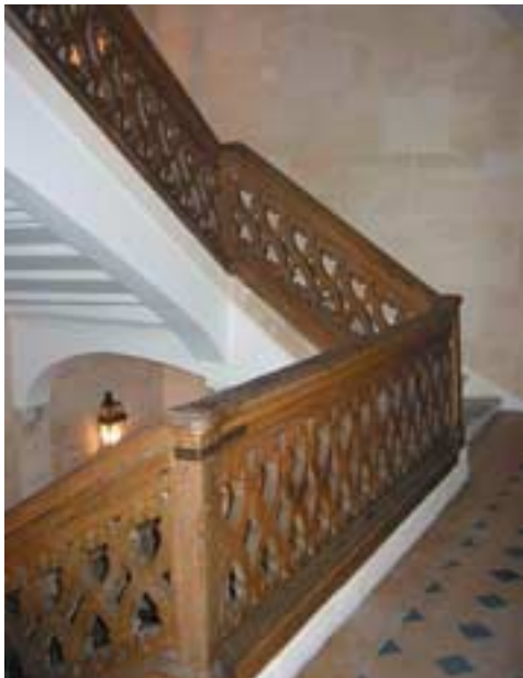
Escalier d'un immeuble rue des Tournelles dans le Marais.