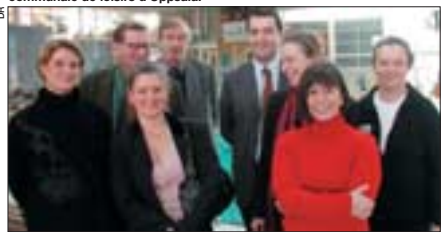
Les participants à Fyrishov, parc aquatique et sportif de la Société communale de loisirs d'Uppsala.

Lors d'un premier séminaire qui s'est tenu en février 2004 à Uppsala (Suède), les dirigeants des EPL ont pu constater qu'ils partageaient trois grandes spécificités : un enracinement territorial, une activité et un personnel saisonnier, une faible rentabilité et d'importants investissements engagés sur le court terme.