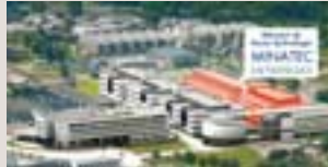
Maitre d'ouvrage : conseil général de l'Isère ; maitre d'œuvre : Groupe 6 ; bureau d'études : Setec.