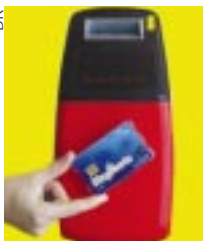
Magicarte facilite les transports à Angoulême.