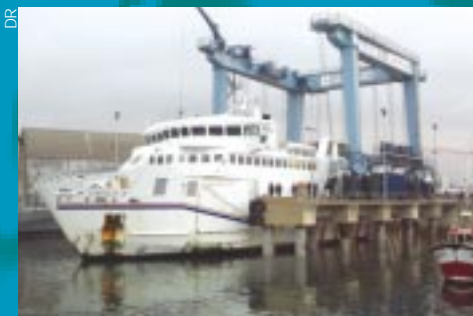
Le nouvel élévateur à bateaux de Lorient-Keroman et le Vindillis qui assure la liaison passagers entre Quiberon et Belle-Ile-en-Mer.

La Sem Lorient-Keroman, concessionnaire du port de pêche de Lorient, a investi 330 000 € pour remplacer l'ancienne criée du marché du "pan coupé" par un système de ventes aux enchères moderne et transparent. Une véritable révolution pour les quelque 150 acheteurs du "pan coupé", poissonniers et mareyeurs, qui, depuis une estrade, participent désormais à l'aide d'un "bip" à des enchères électroniques. Une ligne de convoyage des caisses de poisson de