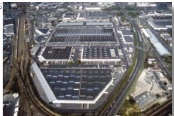
Le MIN de Rungis : une ville dans la ville

tiques louées à plus de 80 entreprises du secteur industriel à Rungis, le groupe a, en effet, depuis 1990, doublé son patrimoine et élargi ses activités à d'autres zones géographiques. A Bayonne, dans un premier temps, puis à Roissy où elle a réalisé, en partenariat avec Aéroports de Paris (60 % Sogaris, 40% ADP), un centre logistique de fret aérien totalisant à ce jour 65 000 m 2 de bâtiments. Suivront en 1995 la réalisation d'une plate-forme terrestre à Grand Lyon-Mions (75 000 m 2 ) et, plus récemment, la réalisation de 20 000 m 2 de