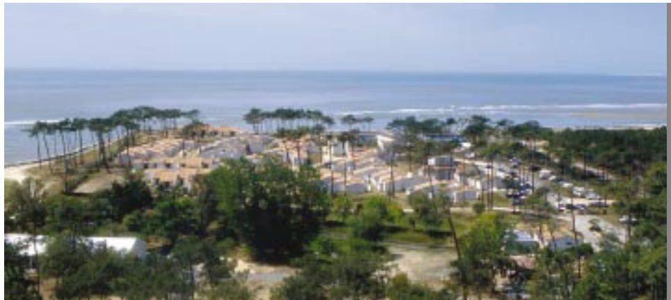
Beauté et qualité exceptionnelle du site pour un nouveau village de vacances du Club Med, dans la catégorie Trois Tridents.

du groupe. Une reprise éventuelle de ce dernier ne modifierait pas sensiblement la donne en ce qui nous concerne. Nous restons, de toute manière, propriétaire de l'actif. Et puis, la beauté et la qualité exceptionnelles du site sont nos meilleurs atouts. Quoi qu'il advienne, nous ne devrions pas être en peine pour lui trouver acquéreur».