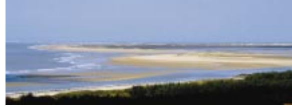
Sem 17, DR.