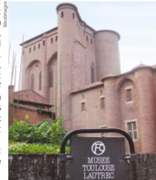
Un chantier de six ans pour la rénovation du musée.

Cette société, spécialisée dans les prêts aux entreprises et aux particuliers devient ainsi le premier établissement financier français à être