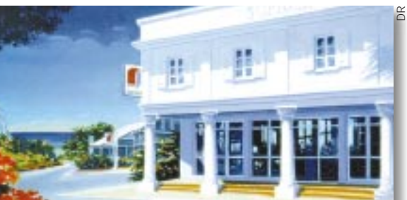
Siège social de la Sofider

certifié Iso 9001 (version 2000, la plus récente) pour l'ensemble de ses activités de crédit. Cette certification récompense la