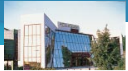
Sem Espace