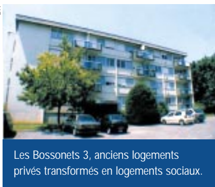
Les Bossonnets 3, anciens logements privés transformés en logements sociaux.

qu'entrera alors en ligne de compte le conventionnement de l'immeuble. D'une allocation logement, les locataires passeront au système de l'APL (aide personnalisée au logement) et seront mieux logés pour moins cher : leur taux d'effort devrait être réduit d'environ 25 %.