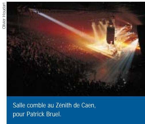
Salle comble au Zénith de Caen, pour Patrick Bruel.

son premier actionnaire privé - et quelques petits porteurs, dont la Fnac.