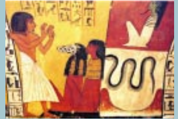
Tombe de Sennedjem, Vallée des Artisans.