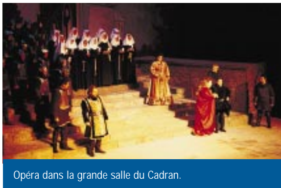
Opéra dans la grande salle du Cadran.

Même s'il est difficile de mesurer toutes les retombées économiques, l'étude effectuée en mars 2001 pour le 10 e anniversaire du Cadran, a mis en évidence quelques chiffres : 1 130 000 visiteurs, 2 500 manifestations organisées, 220 000 cocktails et repas servis et 30 000 nuitées réservées (il s'agit là des seules