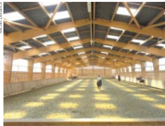
Initiation aux activités hippiques, dans un cadre conçu par l'architecte Massimiliano Fuksas.