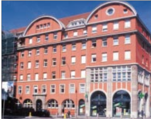
La résidence Lausanne, réhabilitée et totalement intégrée dans le tissu urbain strasbourgeois.

région, du conseil général et de la Cus se sont élevées à 1 million d'euros ; pour sa part, l'Etat a apporté 0,8 million d'euros de subventions. L'opération est parfaitement équilibrée et les résidents parfaitement solvabilisés par l'APL.