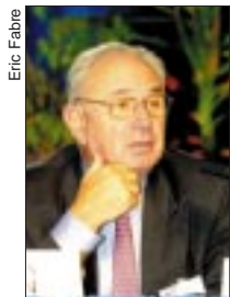
Paul Girod, rapporteur au Sénat.

La Fnsem voit là l'aboutissement d'une discussion parlementaire portant sur un texte déposé à son initiative par les députés et sénateurs et qui intéresse les quelque 1 250 Sem françaises, tout comme leurs collectivités actionnaires.