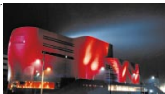
Magnifique silhouette pour le dernier théâtre du XX e siècle, en France.